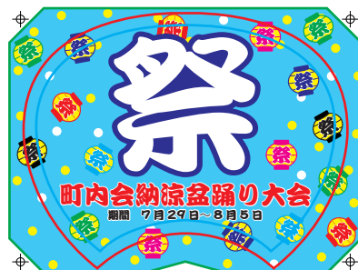
セーフエリアからはみ出た文字