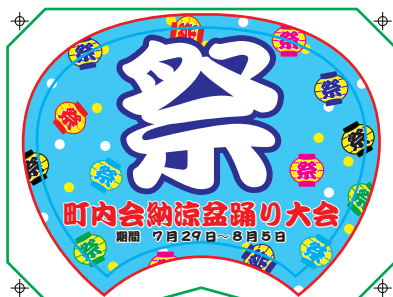
塗り足しの無いデータ